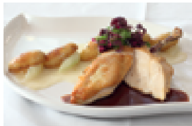
Maishähnchenbrust an Rahmkohlrabi mit Kräuterkartoffeln

Das Rezept des Hauses finden Sie auf Seite 137